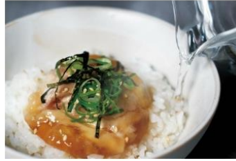
【八幡浜市】愛媛真鯛の炙り鯛めし