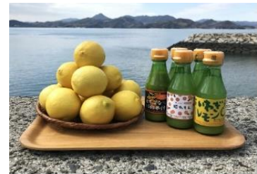
【上島町】レモン16玉と果汁3種セット