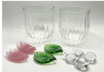
【松野町】コップと箸置きセット