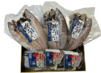
【伊方町】宇和海 海の幸詰め合わせ