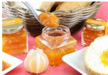
【鬼北町】鬼灯ジャムセット