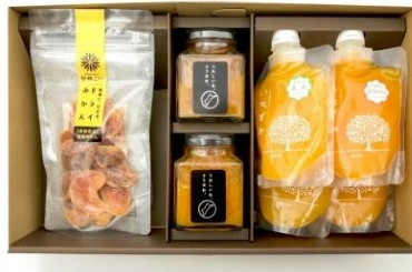
【松前町】himetaiyouみかん詰め合わせ