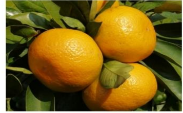
【宇和島市】愛媛県産みかん3kg 2箱