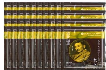
【松山市】道後ドリップ珈琲40P