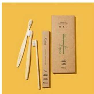
脱プラ生活はここからスタート。 生分解性100%の竹歯ブラシ