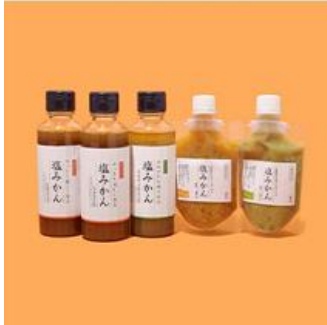
間引きみかんから生まれた、 新しい調味料“塩みかん”