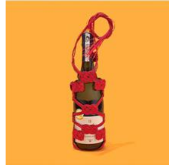
愛媛の伝統工芸をアップデート。 水引のワインボトルサック