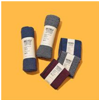
軽量・速乾で持ち運びにぴったりな、 リサイクル素材の今治製タオル