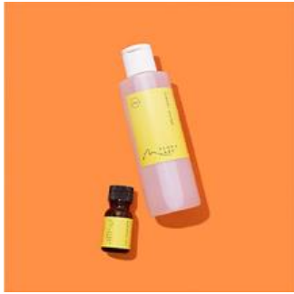
“捨てるにはもったいない”柑橘の皮を 活用した、エッセンシャルオイル

愛媛のサステナブルな商品の中から、特に注目のアイテムをピックアップ。 サイトでは環境・社会・経済に配慮されたストーリーを紐解きながらご紹介しています。