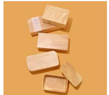
“年輪”を感じながら長く使っていきたい。 媛ひのきの弁当箱