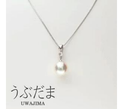
うぶだま UWAJIMA 「土居真珠」 うぶだま（真珠ペンダント）