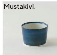
「free design」 砥部焼カップ