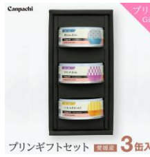
プリンギフトセット 全3色 3色入 「W-harmony」 プリンギフトセット