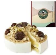
「魔法洋菓子店ソルシエ」 和栗モンブランケーキ