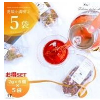
「ハーブガーデンmoco」 ハーブティセット