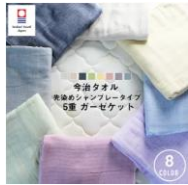
「瀬戸内ソムリエ」 今治タオル 5重ガーゼケット