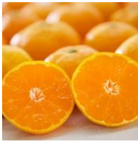
「みかんの花」 愛媛・八幡浜みかん（秀逸）

愛媛の美味しい「食」や優れた技術によって作り出される「モノ」を、より多くの方々に知って頂くために立ち上げた県産品の販促ブランドです。