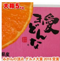
「みさき果樹園」 愛まどな5キロ