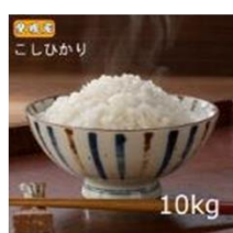
「お米のもりかわ」 令和2年産 新米 愛媛県産 こしひかり10キロ