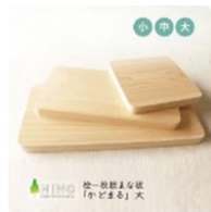
「四国加工」 ひのき一枚板 まな板 「かどまる」(大)