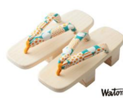
「匠の技・粋な下駄わとみ」 ひのき女二枚下駄白木