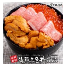
「マグロの吉井」 海鮮三色丼