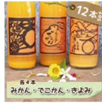
「ホリ田や」 島みかんジュースセット