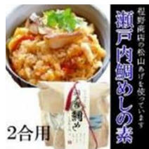
「愛ある愛媛いいよかん」 タイ飯の素2合用