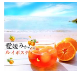
「ハーブガーデンmoco楽天市場店」 愛媛みかんのルイボスティー