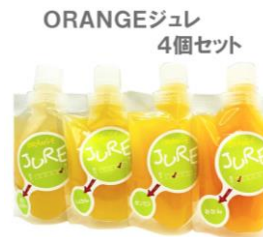
「愛ある愛媛いいよかん」 AISHISU(株) オレンジジュレ4 個セット(みかん・伊予柑・ボンカ ン・河内晩柑)