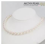
「Seashore」 花珠 パール ネックレス イヤリング フォーマルセット