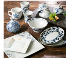
「FUJI netshop」 砥部焼ききよし窯 スクエアプレート ミニバラ