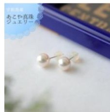
「愛媛県漁業協同組合」 【宇和島産真珠】アコヤパールピアス