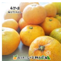
「みかんの楽園 希望の島」 極早生5kgご家庭用