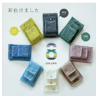
「トップファクトリー」 今治タオル ガーゼ