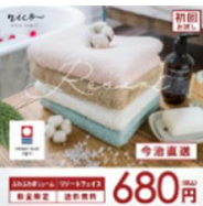
「今治タオルnico」 今治タオルリゾートタオル