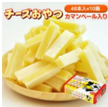
「おつまみ探検隊」 チーズおやつカマンベール