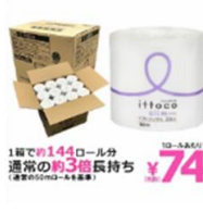
「イトマダイレクト」 トイレトーパー