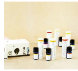
「愛ある愛媛いいよかん」 三洋興産(株)【媛香蔵エッセン シャルオイル(伊予柑)】