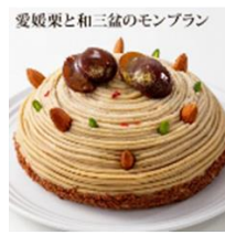
「ラ・ファミユ」 愛媛栗と和三盆のモンブラン