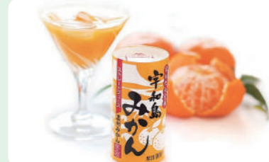
果汁100%ストレートジュース