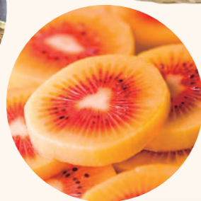
レインボー キウイ