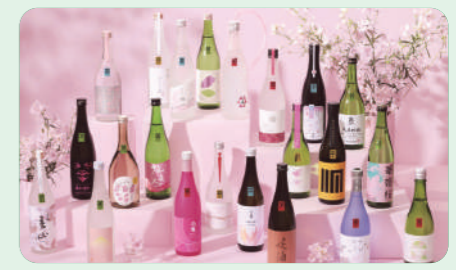
さくらひめシリーズ