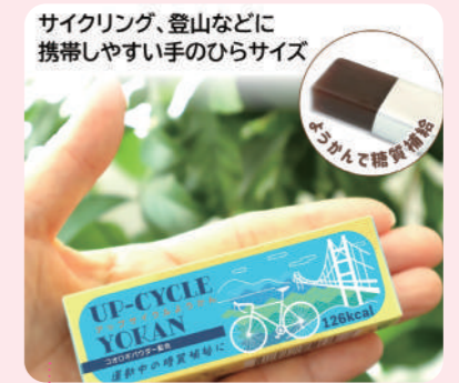
サイクリング、登山などに 携帯しやすい手のひらサイズ