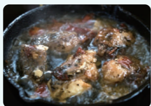
瀬戸内バル 鯛とドライトマトの バジルオリーブ