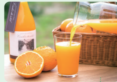
双海のミカンジュース