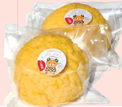
みかんメロンパン