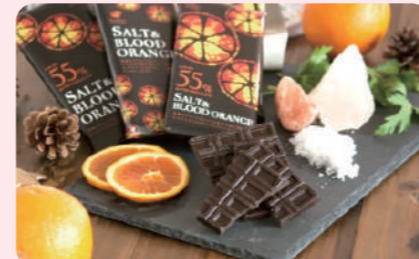
ブラッドオレンジ塩チョコレート