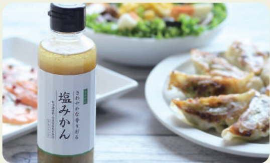
塩みかンドレッシング