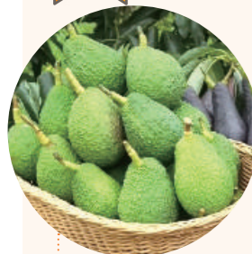
国産自然栽培 アボカド