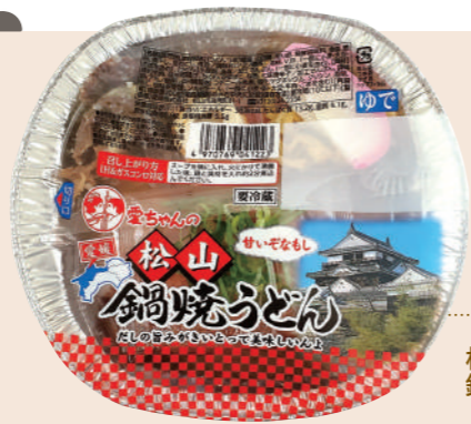
松山 鍋焼きうどん