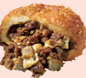
カリットカレー じゃこ天