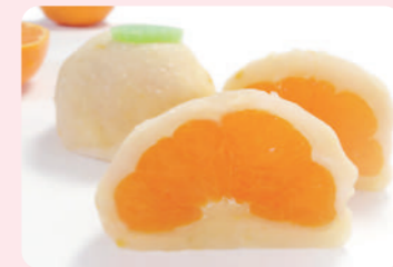
みっちゃん大福プレミアム