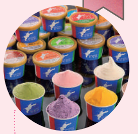
イタリアンジェラート