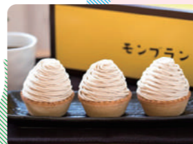
城川オリジナルモンブラン