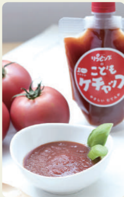
こどもケチャップ