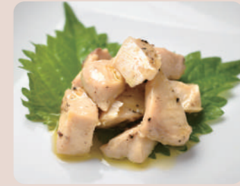
戸島ブリのオリーブオイルづけ