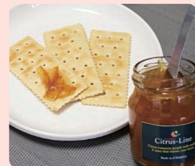
マーマレード&ジャム