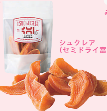
シュクレア (セミドライ富士柿)